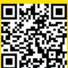
Ilustração: Luiz Fernando Vieira

PROJETO GRÁFICO: CENTRO DE COMUNICAÇÃO SOCIAL DO EXÉRCITO - 2020 / MACHÊ